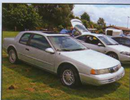
Der amerikanische "Vorgänger" war auch da