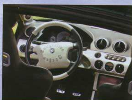
Kreativität bis ins Lenkrad