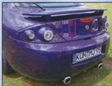
Heckschürze nach Maß