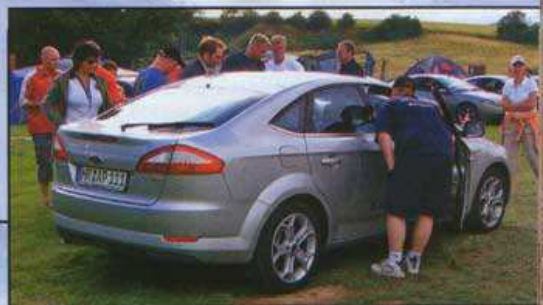
Der örtliche Ford-Händler präsentierte den neuen Mondeo

Wer glaubt, dass sich in Borken nur Käfer treffen (sorry für den flachen Gag...), sah sich zumindest am dritten Juni-Wochenende getäuscht: 65 Wildkatzen fanden sich auf dem Gelände des Hundesportvereins ein. Das Cougar-Treffen in der Mitte Deutschlands hat sich eben in der Szene etabliert!