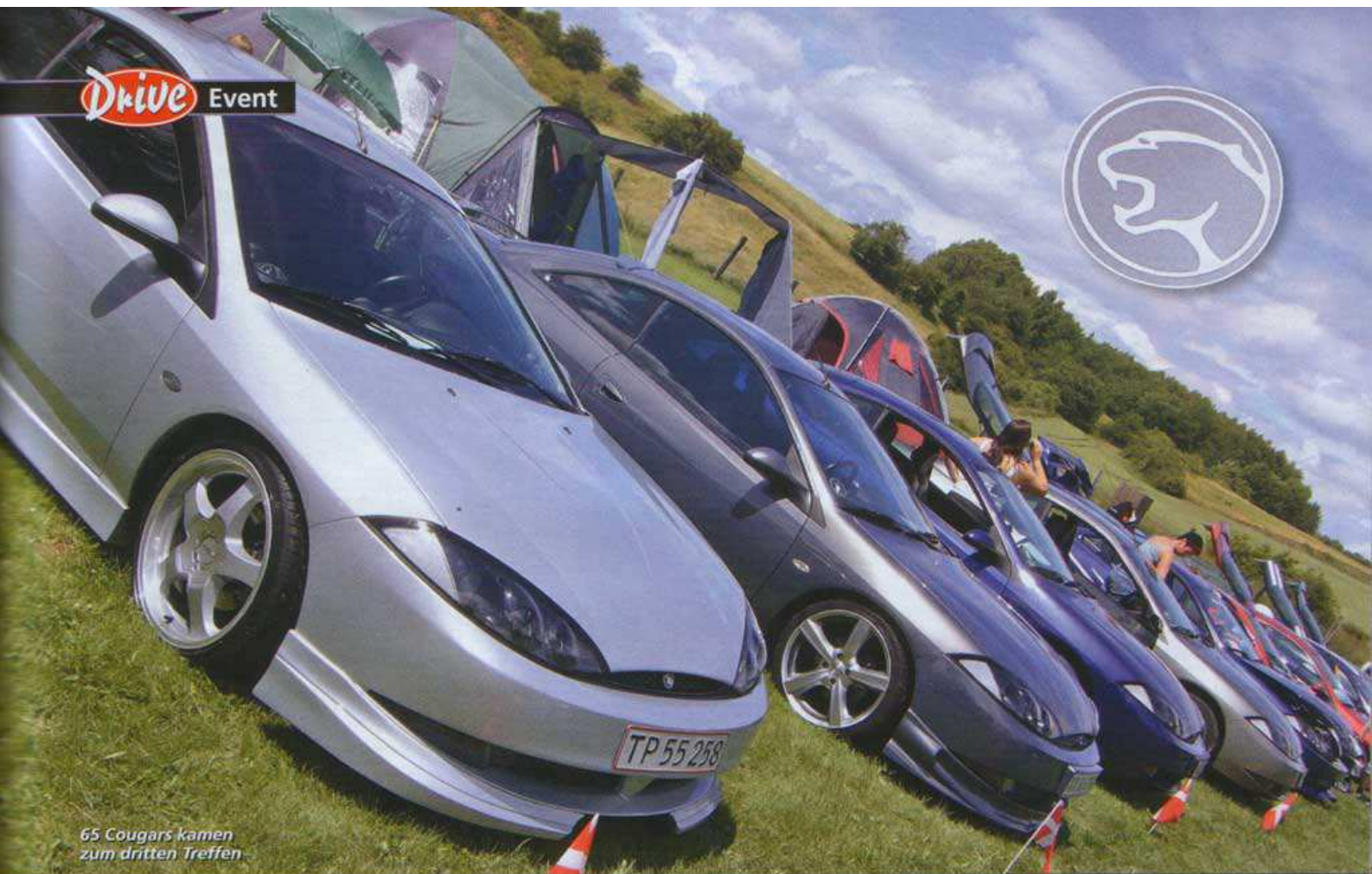
65 Cougars kamen zum dritten Treffen