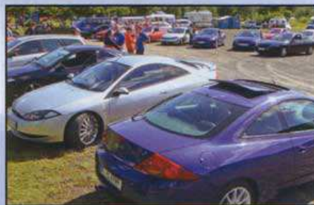
Am Sammelpunkt vor der Ausfahrt