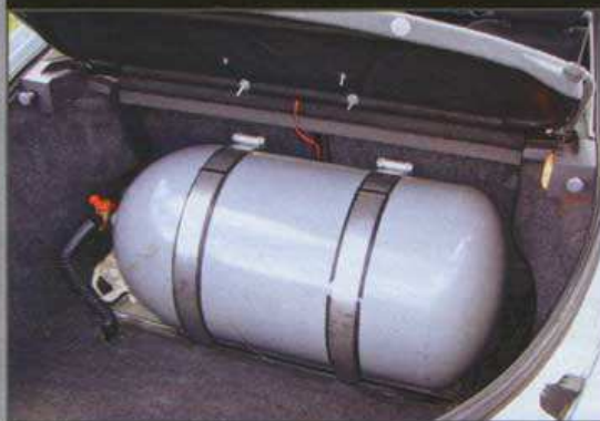
Der Gastank kostet Platz