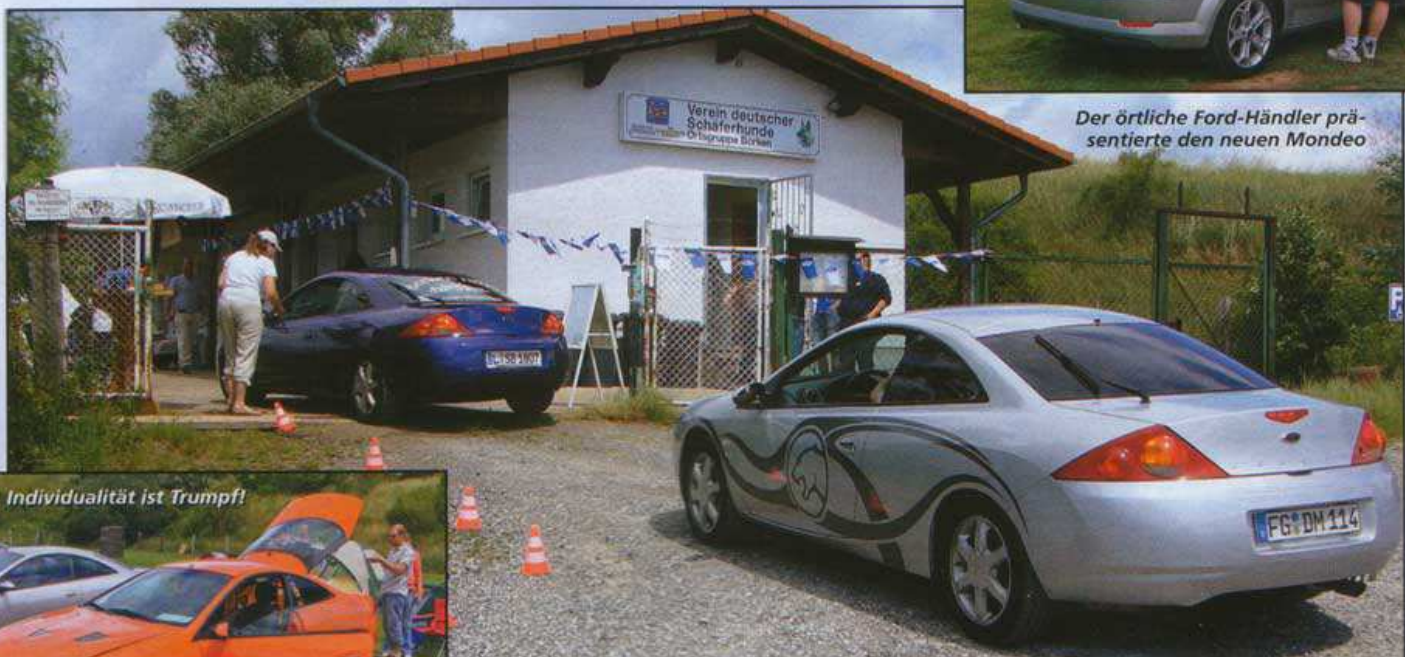
Individualität ist Trumpf!