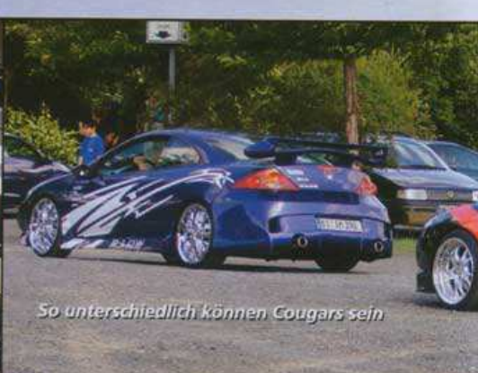
So unterschiedlich können Cougars sein