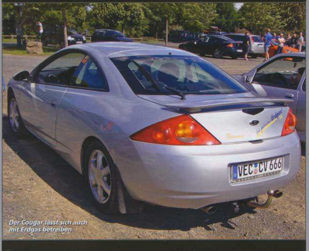
Der Cougar lässt sich auch mit Erdgas betreiben