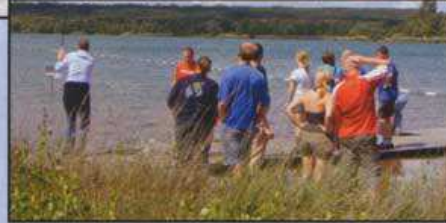
Am Samstag ging's zum Aqua-Golf